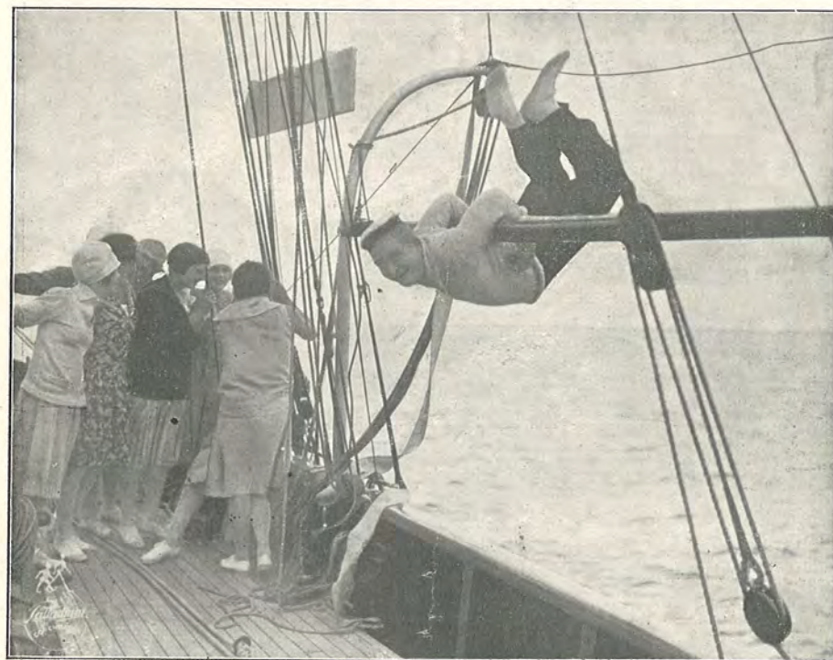
Bivognen gør Kunster

rige Onkel netop er rejst paa Ferie, engagerer han dem som Sømænd og inviterer — i Onklens Navn — Bestyrerinden og alle de unge Damer fra Instituttet ud paa en Sejltur med Onkels store, flotte Yacht. Den ud-spekulerede Hans og de to Sømænd er maskerede saaledes, at Bestyrerinden næppe vil kunne genkende dem, og Hans regner med, at han paa denne Maade kan faa Lov til at tale uforstyrret med Elinor. Men det gaar dog ikke, som han har tænkt sig, Bestyrerinden gennemskuer Rævestregerne og overtager selv Kommandoen paa Yachten.