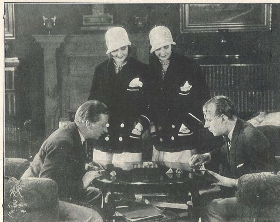
Scenebilleder fra „Kraft og Skønhed“, som blev en mægtig Latter-Succes.