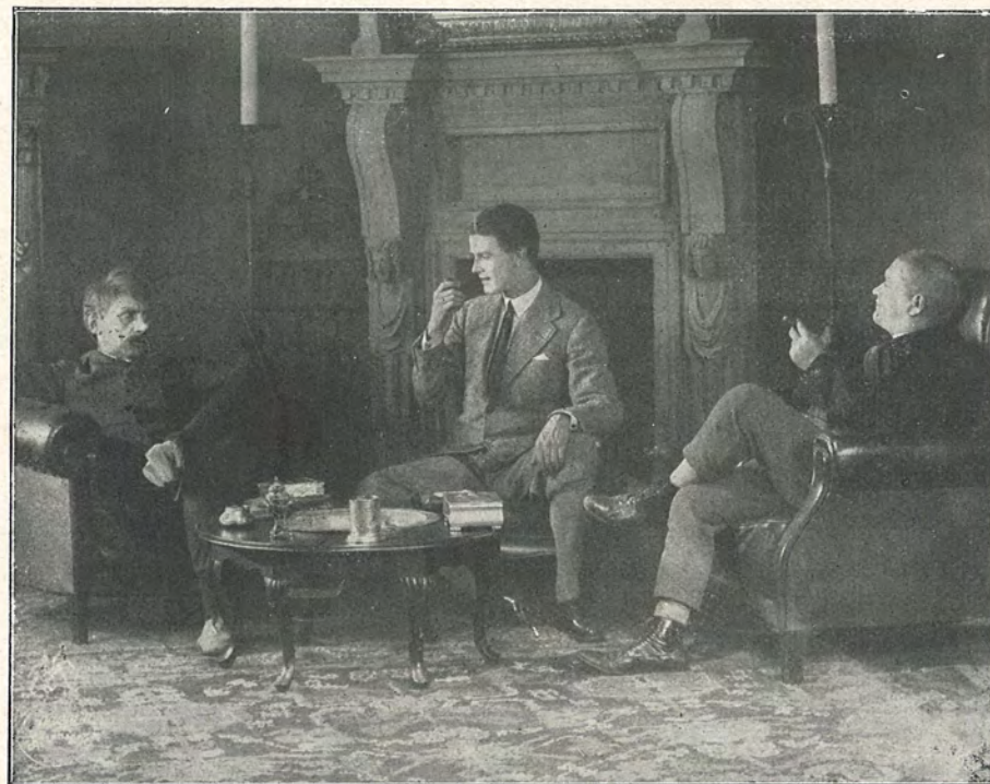
Sig mig — kan I sejle en Baad?"

Teglværkets Ejer, den gamle Professor Owen, er hendes Onkel og