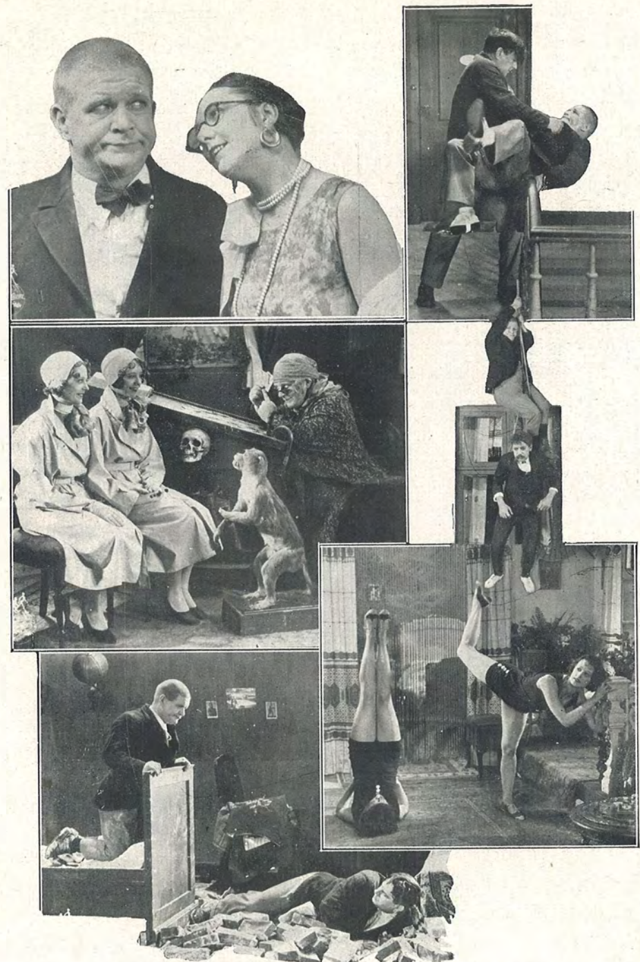
Scenebilleder fra „Højt paa en Kvist!“

Til en Sagfører i Byen kommer en Meddelelse fra Amerika om at