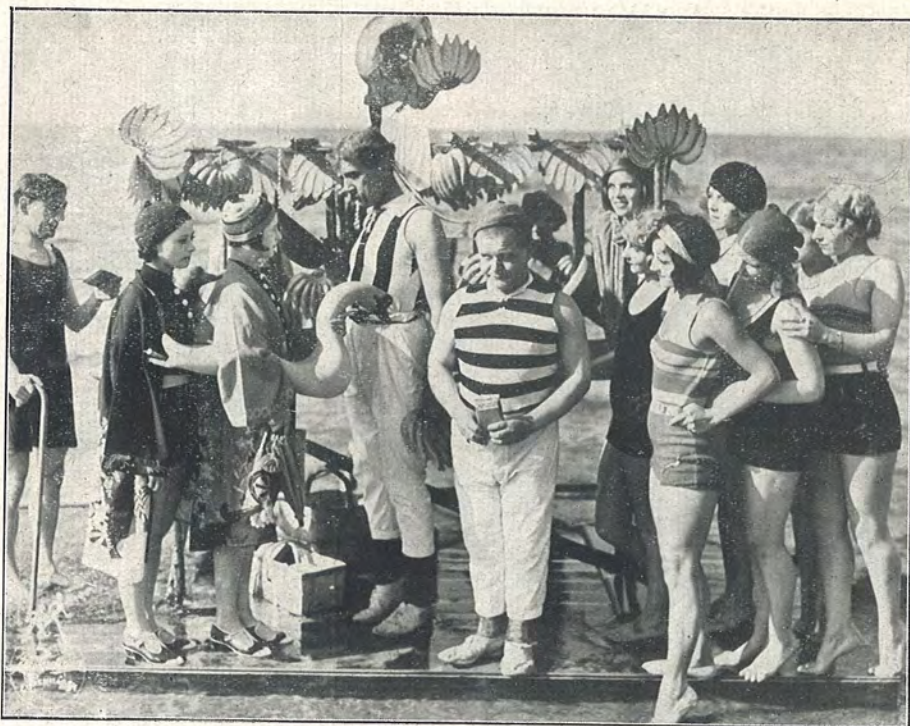
Fy og Bi er Bananmænd om Søndagen

finde en Mand, som er Arving til en indvandret Amerikaners efterladte Rigdom. Sagføreren faar opsnuset, at Arvingen er — Bivognen! Denne Kendsgerning fortæller Sagføreren ikke til nogen undtagen sin Datter, thi det er hans snedigt udtænkte Plan, at hun skal gøre Bivognens Bekendtskab paa romantisk Maade, saa det kan danne Grundlaget for en Forlovelse, og først naar det intetanende Offer har lovet hende Ægteskab — — skal han have Meddelelse om Arven.