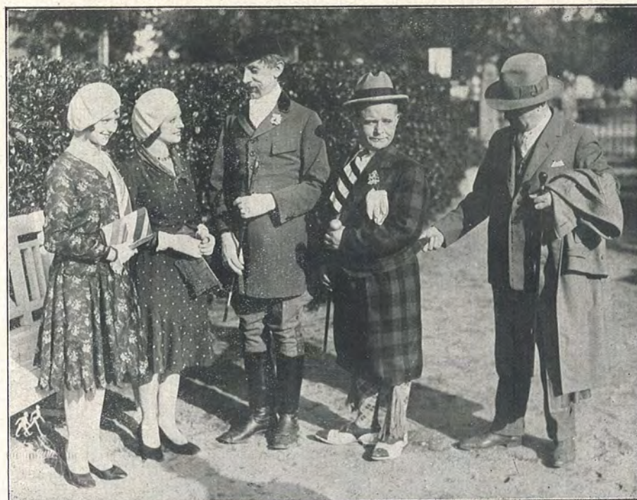
To fine Herrer

»Skovgæsterne« maa søge Ly i en ældgammel Klosterruin, hvor