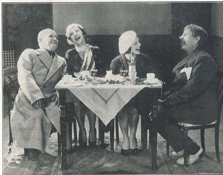
En god Historie!