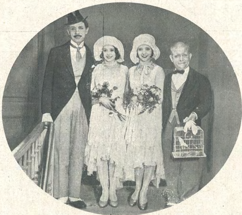
Det er saa yndigt . . .

Nu synes Spaadommen at skulle gaa i Opfyldelse, Rigdom og ægteskabelig Lykke venter vore haardtprøvede Helte, men da de paa deres Bryllupsdag skal begive sig til Kirke — staar pludselig Sparkonge foran dem, nemlig Bokseren! Styrket af Livets Medgang — giver Bivognen ham den Medfart, han længe har trængt til, og sammen med sin lange, uadskillelige Ven og de to unge Piger vandrer Bivognen ud til en lys og — efter alt at dømme — lykkelig Fremtid!