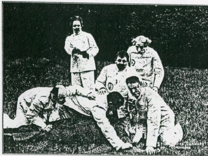
Hospitalscenen af „Katastrofen i Dokken“

Alt dette elementære kunde Frstrup paa sine Fingre, han var en Mester i at servere dramatisk. Saa var det Tilfældet førte ham sam-